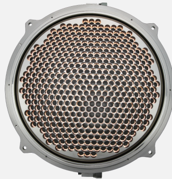
AMAT RTP Lamphousing